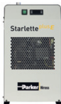
Dotato di controllo digitale