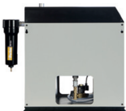
Una nicchia passante permette un facile accesso allo scaricatore da entrambi i lati