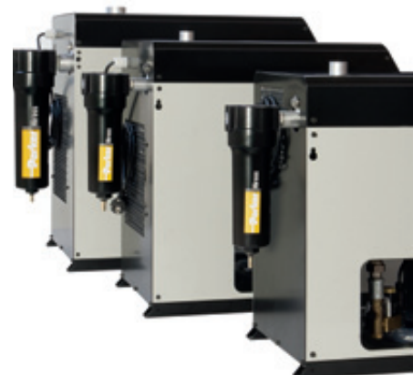
Opzione con pre-filtro (non fa parte della dotazione standard)